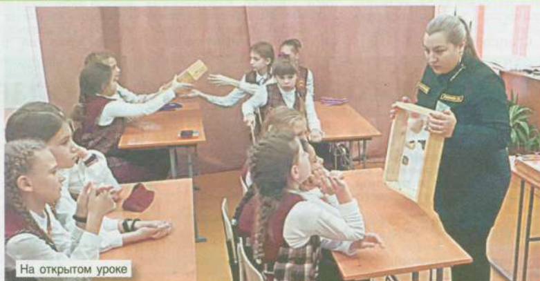
На открытом уроке

В течение года неоднократно размещалась информация на страницах общественно-экологического издания «Природа Алтая», в региональном приложении общественно-политического издания «Российская газета», краевой массовой газете «Алтайская правда», газете «Профсоюзы Алтая».