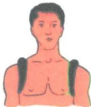
Материальными кольцами (ключицы)