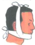
Правильной повязкой (нижней челюсти)