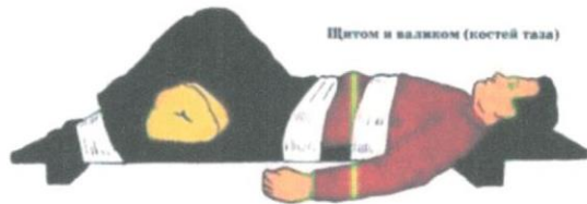
Щитом и валиком (костей таза)